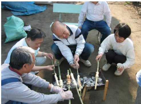
▲なんでしょうこれ☆手作りパンを焼いています。すごくおいしいんです！