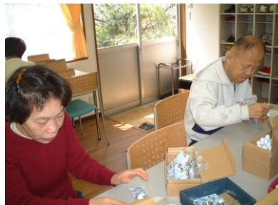
電球の袋詰作業のようす