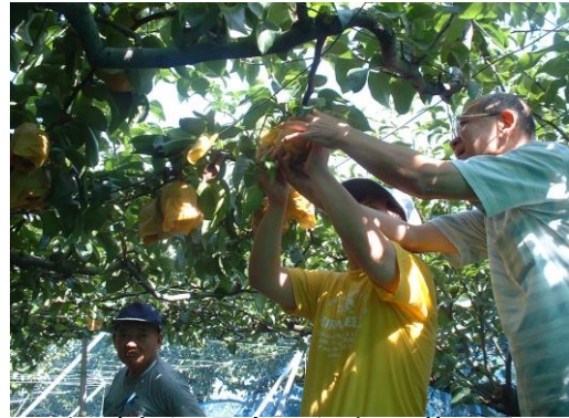
▲天気が良くて最高！梨狩りin菅沼園

私たちは、定年を迎えた人たちが中心のグループです。散歩やリズム体操をして健康でいられるように気を付けながら生活しています。料理をしたり、ボランティアさんに協力してもらって書道や生け花を楽しむ人もいます。外出もたくさんします。イチゴ狩り、梨狩り、映画を観に行ったり、そして、その他いろいろです。電車やバスを利用したり、車で遠いところまでドライブしたり…。出かけた先で喫茶することが楽しみです。これからは自分たちの趣味をもっとみつけれたら良いなと思います。