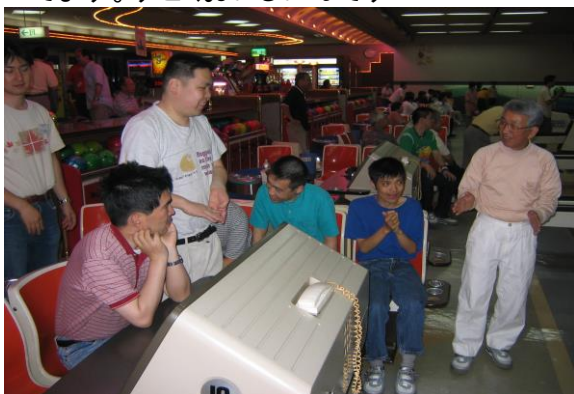
▲ボーリングを楽しんでいます

私たちは、平日は仕事をしています。毎日仕事の終わった後の時間は、それぞれが自由に過ごしています。ゲームやパズルをする人もいれば、プールに行ったり、ボランティアさんとマラソンをする人もいます。趣味のビデオを借りに行く人や、散歩や買物に行く人もいます。ひとりで出かけて買物をする練習をしている人もいます。また、週に一度の作業のない午後には車でどこかへ出かけたり、園内で料理作りやカラオケをして楽しんでいます。