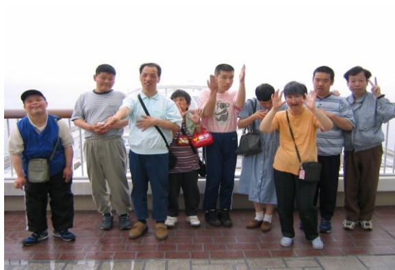
▲海ほたるに行ってきました～！