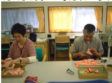
三角くじの作業のようす

ちなみに「らんぷ」の名前の由来はランプを入れる仕事をしているので、皆さんにもなじみがあったため、ランプなだけに「らんぷ」となりました(笑)