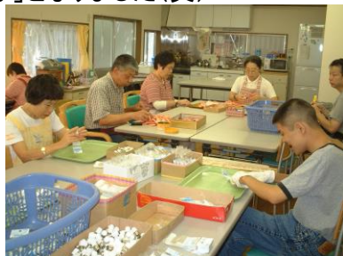
らんぷの作業場です