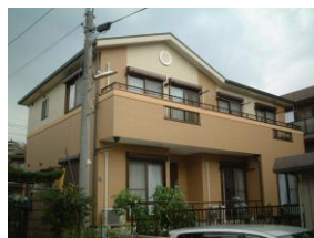
鶴ヶ峰ガーデンです